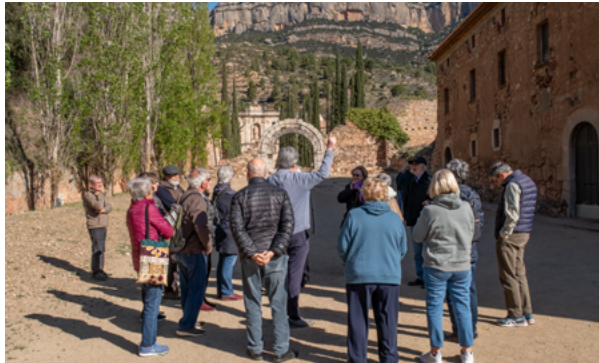
Sortida a Escaladei