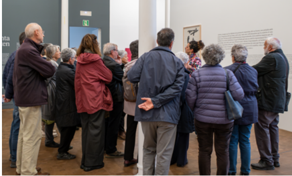
Sortida a la Fundació Tàpies, dins el taller d'història de l'art