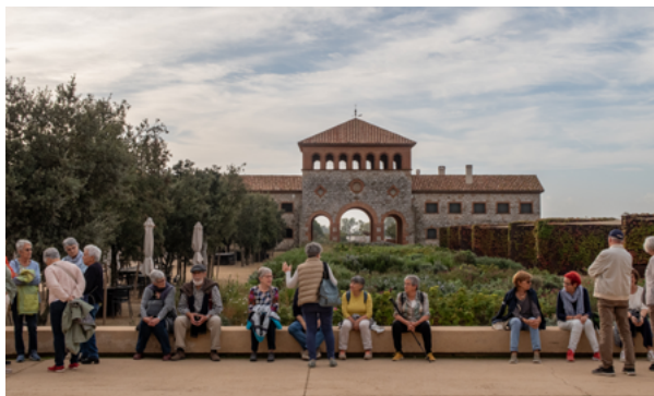
Sortida a Perelada.