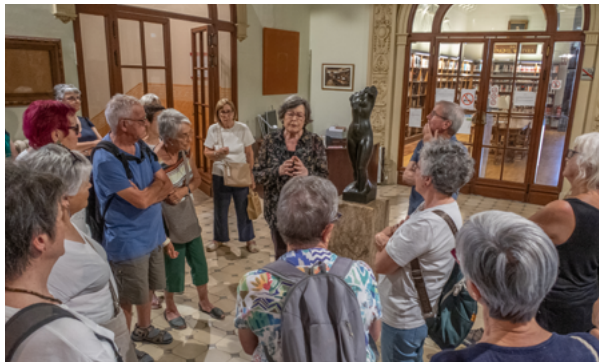
Ruta del modernisme a Reus