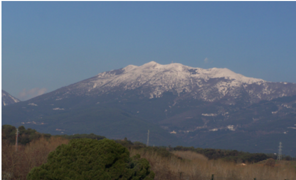
Vall Alta de la Tordera. Al cor del Montseny