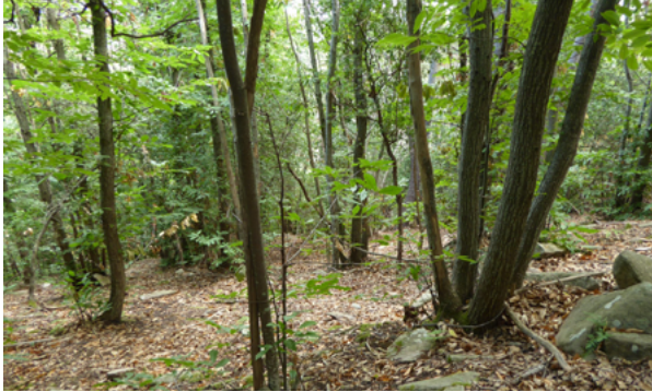
Plantació de Castanyers.