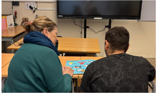
Acompanyament a la lectura

Durant l'any 2024 el GAM ha continuat amb l'acompanyament a la gent gran. El número de voluntaris en aquest àmbit no creix, però s'estan cobrint totes les demandes que arriben.