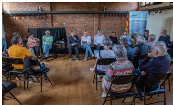
Assemblea general. Maig 2024

Durant l'any 2024, l'Associació ha continuat amb les seves tasques habituals i com a novetats, ha impulsat una enquesta per esbrinar les necessitats de la Vall en l'horitzó 2030 i un conveni amb la Diputació de Barcelona i ISVAT per treballar en diversos projectes amb El Parc Natural del Montseny.