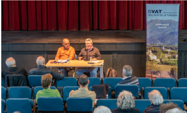
Xerrada Xavier Rius. "L'auge del nacional-populisme i l'extrema dreta a Europa: per què i com fer-hi front"